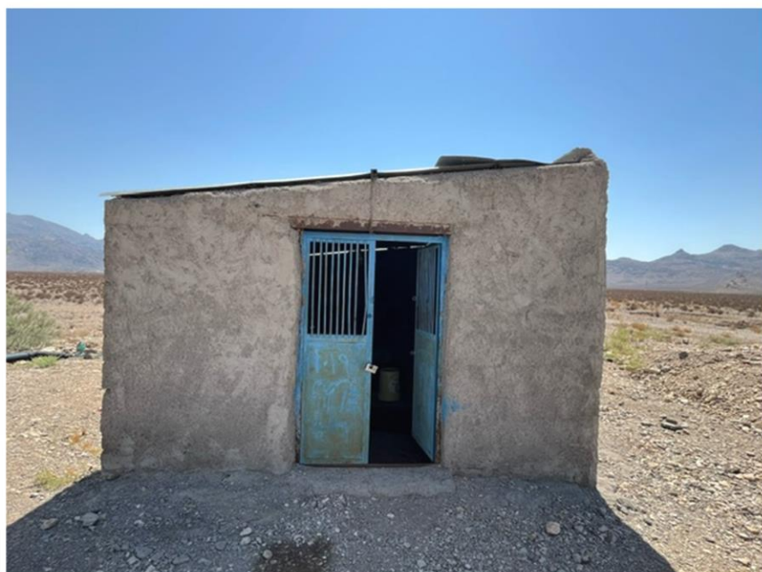
اتاق موتور پمپ